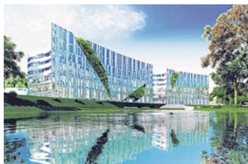
Der Kö-Bogen wird 2013 fertig sein. In dem Jahr rechnen die Immobilienmakler mit einem neuen Spitzenwert an Vermietungen. ANIMATION: DEVELOPER/CADMAN

1,3 Milliarden Euro sind 2010 in Düsseldorf investiert worden. Das ist ebenfalls der zweithöchste Wert