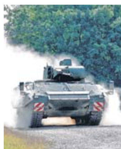
Rheinmetall produziert auch den Schützenpanzer Puma.

Millionen Euro. Rheinmetall gehört international zu den größten Unternehmen der Verteidigungs- und Sicherheitsindustrie. Der Düsseldorfer Konzern beschäftigt weltweit etwa 10 000 Mitarbeiter. Im Jahr 2009 erzielte die Rheinmetall-Rüstungssparte Defence einen Umsatz von rund 1,9 Milliarden Euro. Zur Produktpalette der Firma zählen gepanzerte Fahrzeuge, Flugabwehrsysteme und diverse Systeme zur passiven Abwehr von Angriffen. Großkunde von Rheinmetall ist vor allem die Bundeswehr. Berühmteste Produkte mit Rheinmetall-Beteiligung sind die Kampfpanzer Leopard 1 und 2, für die die Düsseldorfer Feuerleit- und Führungsanlagen lieferten.